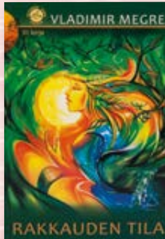
Anastasia III-kirja Rakkauden tila