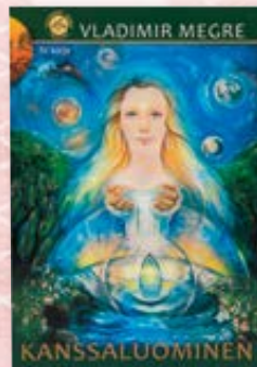
Anastasia IV-kirja Kanssaluominen

”Missään Maailmankaikkeudessa ei ole soitinta, joka pystyisi soimaan ihmisieluä kauniimminkin.” Anastasia