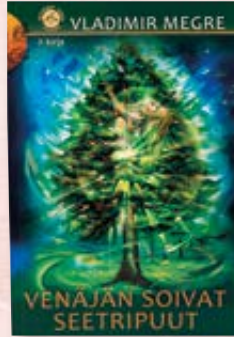
Anastasia II-kirja Venäjän soivat seetripuut